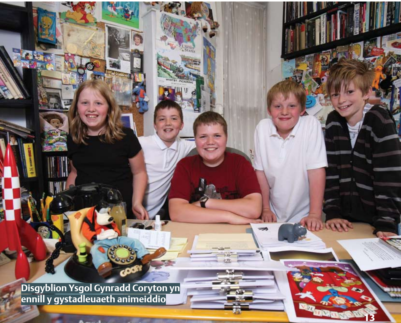
Disgyblion Ysgol Gynradd Coryton yn ennill y gystadleuaeth animeiddio