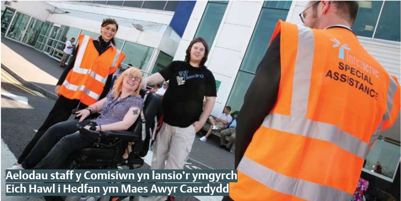
Aelodau staff y Comisiwn yn lansio'r ymgyrch Eich Hawl i Hedfan ym Maes Awyr Caerdydd