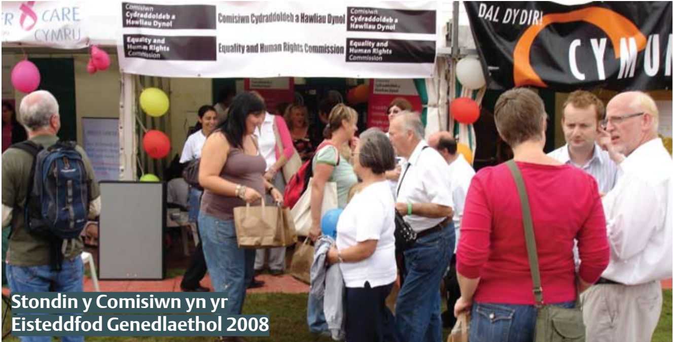
Stodin y Comisiwn yn yr Eisteddfod Genedlaethol 2008