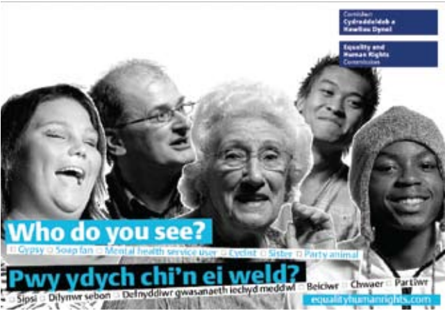
Cardiau post Pwy ydych chi'n ei weld?