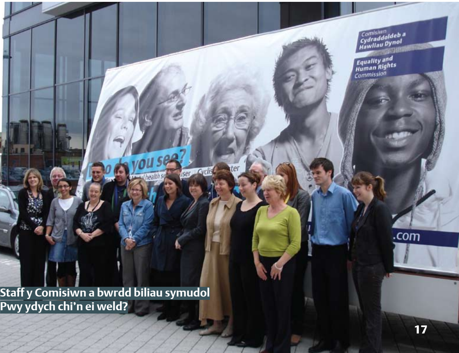
Staff y Comisiwn a bwrdd biliau symudol Pwy ydych chi'n ei weld?